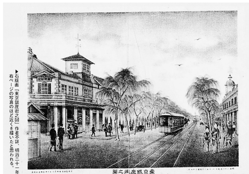
明治21年の東京銀座街之図（作者不明、『銀座百点』第822号から引用）